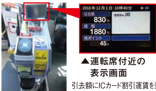
▲運転席付近の 表示画面

ICカード割引運賃はバス車内前方の運賃モニターに表示される金額と異なります。 精算時、ICカードをカードリーダーヘタッチすると運転席付近の表示画面に、ICカード割引運賃が引去額として表示されます。