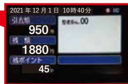
▲運転席付近の表示画面 引去額にICカード割引運賃を表示