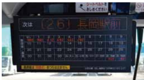
◀バス車内前方にある 運賃表モニター 現金でお支払いの 区間運賃を表示