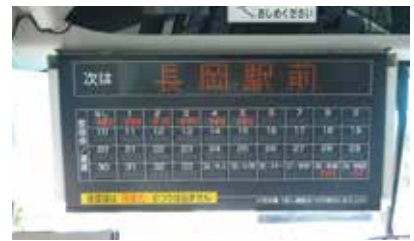
▲バス車内前方にある運賃表モニター 現金でお支払いの区間運賃を表示