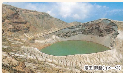
蔵王 御釜(イメージ)