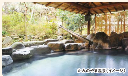
かみのやま温泉(イメージ)