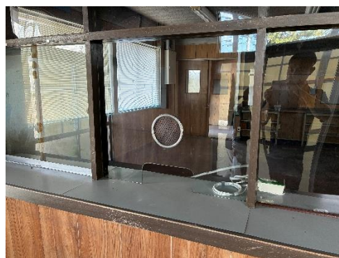
↑ 解体数日前の様子