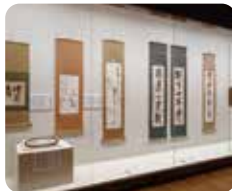
spot 01 ①AM 10:00 新潟市 曾津八一記念館