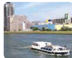
spot 02 ①PM 1:20 信濃川 ウォーターシャトル