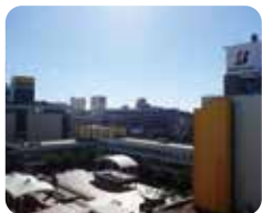
spot 03 ①PM 1:35 万代シテイ

信濃川での船上クルーズや水族館で自然界の神秘を体感するロマンチックコース。カジュアルに、そしてオシャレに。フレンチや中華でデートもバッチリ。