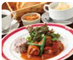
spot 01 ①PM 12:00 BISTRO fleu fleu