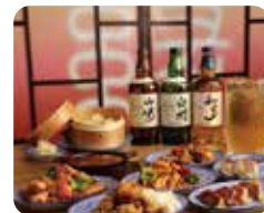
spot 05 ①PM 5:40 縁 China