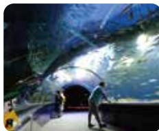
spot 04 ①PM 2:40 新潟市水族館 マリニピア日本海