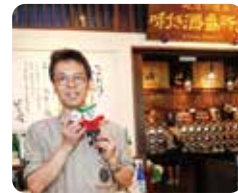
spot 05 ①PM 4:15 ほんしゅ館 新潟駅店