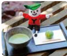
spot 04 ①PM 2:30 旧斎藤家別邸