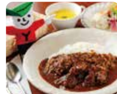
spot 02 ①AM 11:30 ピアア軒