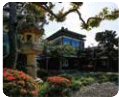
spot 03 ①PM 1:10 北方文化博物館 新潟分館

新潟が誇る、偉人や建物や庭園、食の名物スポットを巡るコース。會津八一の生き様や晩年を過ごした屋敷などを訪れ、新潟の歴史情緒に触れる一日。