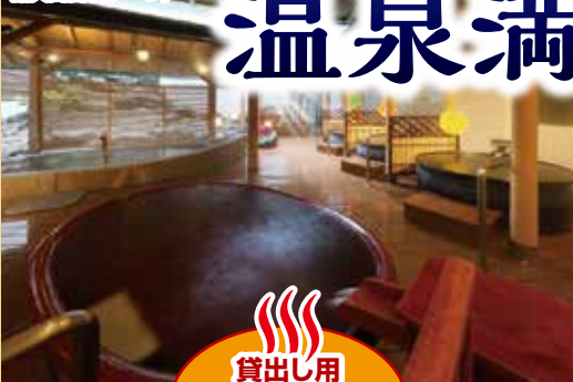
露天風呂(イメージ)