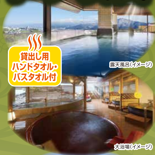
露天風呂(イメージ)