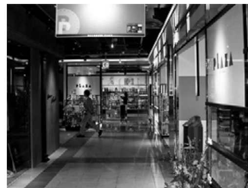
平成19年3月 ビルボードプレイス リニューアルオープン