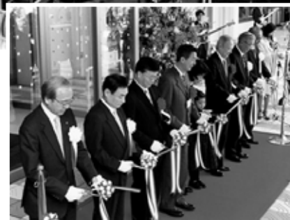
平成19年3月 ラブラ万代グランドオープン